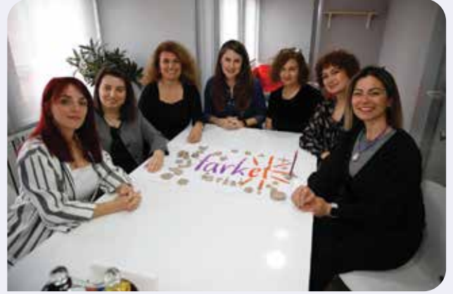
Farklıyız Eşitiz Derneği (Fark-Et) yakın zamanda Çanakkale'de kuruldu

Derneğimizin KİHEP ile doğrudan ilişkisi var, KİHEP'in amaçları ile derneğimizin amaçları örtüşüyor. Derneğimizin üyelerinin yarısı KİHEP'li kadınlardan oluşuyor. Bundan sonrası için de KİHEP, derneğimizin rutin eğitimleri arasında yer alacak.