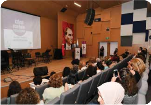
Karabağlar KİHEP Sertifika Töreni

Karabağlar KİHEP Sertifika Töreni: 13 Haziran 2023'te Karabağlar Kent Konseyi ve Karabağlar Belediyesi bünyesinde düzenlenen KİHEP grup çalışmaları için büyük bir sertifika töreni düzenlendi. Altı farklı KİHEP grubunun katılımcılarının sertifika törenine yaklaşık 200 kadın katıldı. Törende düzenlenen serbest kürsü etkinliği ile katılımcılar KİHEP'e dair duygu ve düşüncelerini paylaştı.