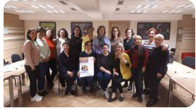
Denizli KİHEP Sertifika Töreni

Denizli KİHEP Sertifika Töreni: 12 Eylül 2023'te Denizli'de Sosyal Hizmet Uzmanları Derneği (SHUDER), 29 Ekim Kadınları Derneği, Türk Kadınlar Birliği, Kadın Haklarını Koruma Derneği ve Türk Kadınlar Konseyi Denizli şubelerinin işbirliğinde gerçekleştirilen KİHEP grup çalışması için bir sertifika töreni düzenlendi. Merkezefendi Belediyesi, Makine Mühendisleri Odası ve Denizli Barosu'nun da destek verdiği sertifika töreninde katılımcılar KİHEP'in kendilerine ve üyesi oldukları kadın örgütlerine neler kattığını paylaştı.