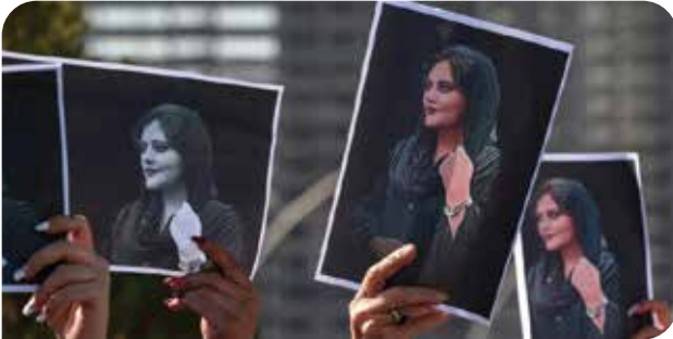
Mahsa Amini'nin ahlak polisi tarafından öldürülmesinin ardından İran'da uzun süreli eylemler başladı

Protestolar hakkında veri paylaştan örgütler arasında bulunan Tahran merkezli İnsan Hakları Aktivistleri Haber Ajansı (HRANA) tarafından açıklanan sayılar 15 Ocak itibariyle şöyleydi 1 : 17 Eylül 2022'den itibaren 255 protesto gösterisi düzenlendi ve bu protestolar sırasında 71'i çocuk olmak üzere 524 kişi hayatını kaybetti. Eylemlerle ilişkili olarak 713'ü öğrenciler olmak üzere 19 bin 401 kişi gözaltına alındı ve/ya tutuklandı. 724 kişi için mahkeme mahkumiyet kararı verdi, toplamda 11 bin 721 ay hapis cezasına hükmedildi ve 4 protestocu idam edildi. İran İnsan Hakları Derneği'nin açıkladığı verilere göreyse 27 Ocak itibariyle idam edilen protestocu sayısı 55'e ulaştı. 2 Hengaw İnsan Hakları Örgütü'nün 8 Mart dolayısıyla yayınladığı rapor 3 , 8 Mart 2022 ile 8 Mart 2023 arasında İran rejiminin en az 245 Kürt kadını tutukladığını ortaya koyarken, Af Örgütü'nün yine Mart'ta yayınlanan raporu 4 ise ülkedeki protestolarda işkence görenler arasında bulunan genç ve çocukların maruz kaldığı şiddete odaklanıyor.