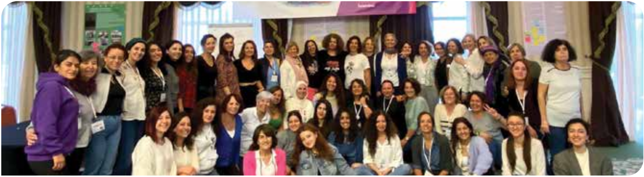
9-11 Kasım’da İstanbul’da düzenlediğimiz KİHEP Eğitici Buluşması’na 80’den fazla KİHEP eğiticisi katıldı

1 https://kadinininsanhaklari.org/wp-content/uploads/2022/06/SR-on-VAW-input-by-Women-for-Womens-Human-Rights.pdf