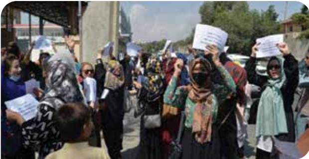
Afganistan'da kadınlar Taliban'ın baskıcı uygulamalarını düzenledikleri eylemlerle protesto ediyor

8 Mart'ta ise düzenledikleri eylemde bir araya gelen kadınlar Taliban'ın baskıcı politikalarına itirazlarını ve kadınlar olarak örgütlü mücadelelerine duydukları inancı dile getirdi. Ayrıca dünyanın dört bir yanındaki kadınlara da "Karanlığa karşı mücadelemizi protesto yoluyla desteklemelerini ve hükümetlerini, Taliban'ı desteklemekten vazgeçirmelerini istiyoruz" diyerek bir dayanışma mesajı ilettiler.