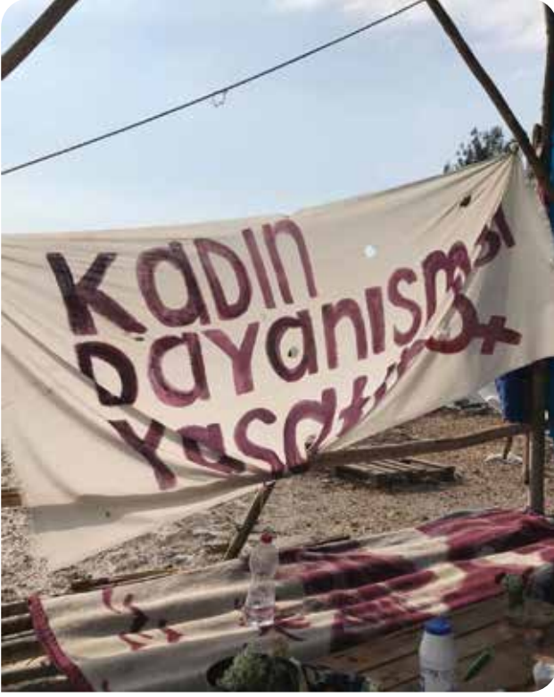
Adiyaman'da kurulan kadın çadırının önü

dağıtımının yapılmaması ya da bu dağıtımın yalnızca erkek gönüllüler/çalışanlar tarafından yapılması gibi nedenlerle kadınların en temel ihtiyaçlara erişimi ya çok zor oldu ya da hiç mümkün olmadı. LGBTİ+'lar güvenlik kaygısı nedeniyle dağıtımların yapıldığı noktalara gidemedi ve ihtiyaçlarına erişemedi. Çadır dağıtımı yapılırken tek yaşayan kadınlara ve LGBTİ+'lara çadır verilmedi.