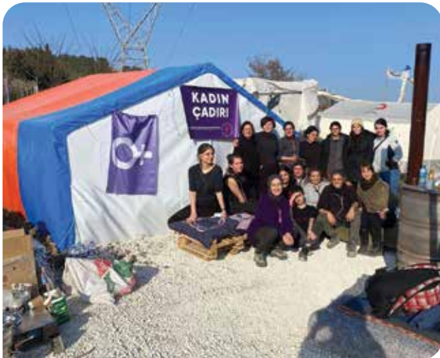
Adıyaman'da kurulan kadın çadırı

7 Şubat sabahı AKP iktidarını ve muhalefeti hayat kurtarmak için yükümlülüklerini yerine getirmeye çağırduğumuz ve daha fazla vakit kaybetmeden atılması gereken adımları belirttiğimiz bir metin yayınladık.