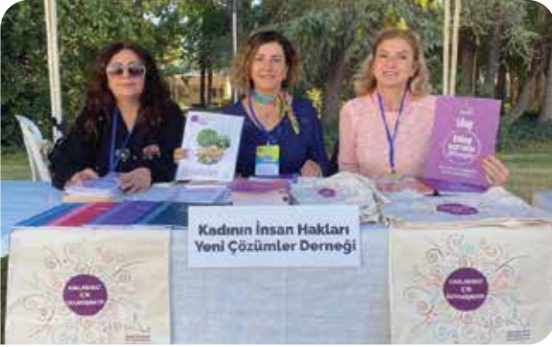
İzmir'de düzenlenen Sivil Sesler Festivali'ndeki KİHEP standı

Sivil Toplum Geliştirme Merkezi tarafından 17-18 Kasım 2023'te İzmir'de düzenlenen Sivil Sesler Festivali'ne, İzmir Kadın Dayanışma Derneği ile birlikte açtığımız KİHEP standı ile katıldık. KİHEP ile ilgili bilgi paylaşımı yaptığımız standımızda sadece İzmir'den değil, çevre illerden de KİHEP için başvurular aldık.