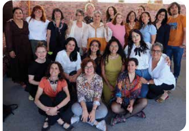
EuroMedRights’ın Kadın Hakları ve Toplumsal Cinsiyet Eşitliği Çalışma Grubu toplantısı

Artık “geleneksel” diyebileceğimiz kampımızın üçüncüsünü 31 Mayıs - 4 Haziran tarihleri arasında Ağva’da gerçekleştirdik. Bir önceki kampta başladığımız stratejik planlama çalışmalarımızın değerlendirmesini sürdürürken, bir sonraki planlama dönemi için bu süreçte çıkardığımız derslerin üzerinden geçtik. Elbette bu kampımızda en önemli gündemlerden bir tanesi seçim sonuçlarının hayatımıza etkileriydi. Tahmin edebileceğiniz gibi kampımızın bir kısmı bu gündem nedeniyle karamsar ve tatsız geçtiyse de; feminist hareketin gücünü, dayanışmamızı hatırlayarak içimizi rahatlattık ve umut dolu bir enerjiyle kampımızı tamamladık.