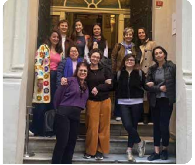
8. Olağan Genel Kurulumuzu 25 Nisan 2023'te gerçekleştirdik

Fös Feminista bizim de KİH olarak üyelerinden biri olduğumuz cinsel sağlık, üreme sağlığı hakları ve adaleti alanında çalışan feminist bir birlik. Fös Feminista her iki yılda bir üyelerini bir forum ile bir araya getirmeyi hedefliyor. Birliğin ilk forumu 28-29 Mart 2023 tarihlerinde gerçekleşti. KİH olarak bizim de katıldığımız bu foruma 34 ülkeden, birliğe üye 70 örgütü temsilen 200'den fazla kişi katıldı. Forumda çoğunluğu birliğin üye örgütlerinden olan 42 konuşmacı, 2 forum kolaylaştırıcısı, 18 tercüman, 13 grafik sanatçısı yer aldı ve etkinlik 44 Fös Feminista çalışanı tarafından desteklendi. Forum boyunca Fös Feminista'nın üç stratejik taahhüdü olan (1) insani yardım durumları da dahil olmak üzere doğum kontrolü, kürtaj, cinsel ve toplumsal cinsiyete dayalı şiddet ve kapsamlı cinsellik eğitimi için bakım ve hizmetlerin genişletilmesi, (2) toplumsal cinsiyet ve üreme adaletini sağlamak için yasalar, politikalar ve sosyal normların dönüştürülmesi ve (3) keşimsel feminist hareketlerin ve örgütlerin güçlendirilmesi üyeler arasında tartışıldı. Paralel oturumlar hariç tüm forumda 4 dil birlikte kullanıldı. Forum çevrimiçi gerçekleşmiş olmasına rağmen müzik, dans ve görsel sanat etkinlikte çokça yer aldı. Forum üyeler tarafından olumlu geri bildirimler aldı, üyeler özellikle diğer üyeleri daha yakından tanımak ve bağlantı kurmak için forumun çok etkili olduğunu ifade etti.