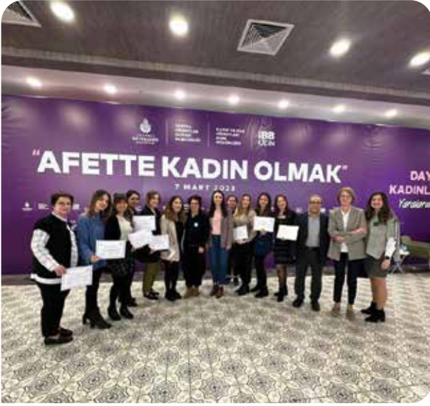
IBB Kentsel Dönüşüm Müdürlüğü çalışanları KİHEP grubu sertifika töreni