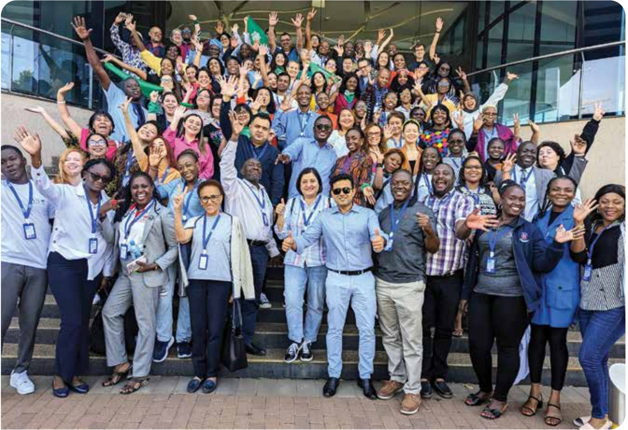
Safe Abortion Action Fund (SAAF) Küresel Buluşma, Nairobi, Kenya

medikal kürtaj ve telemedikal hizmetler, kürtaj konusunda medya ve görsel materyallerin kullanımı üzerine bilgiler paylaşıldı ve tartışmalar yürütüldü. Oldukça verimli ve ilham verici geçen bu üç günlük buluşmada Türkiye'de kürtaj hakkını iyileştirmek için verdiğimiz mücadeleye katkı sunabilecek birçok deneyim dinledik. Önümüzdeki sene Mor Çatı ve Women on Web işbirliğinde başlayacağımız kürtaj hakkı özelindeki projemizin detaylarını en kısa sürede sizinle paylaşacağız.