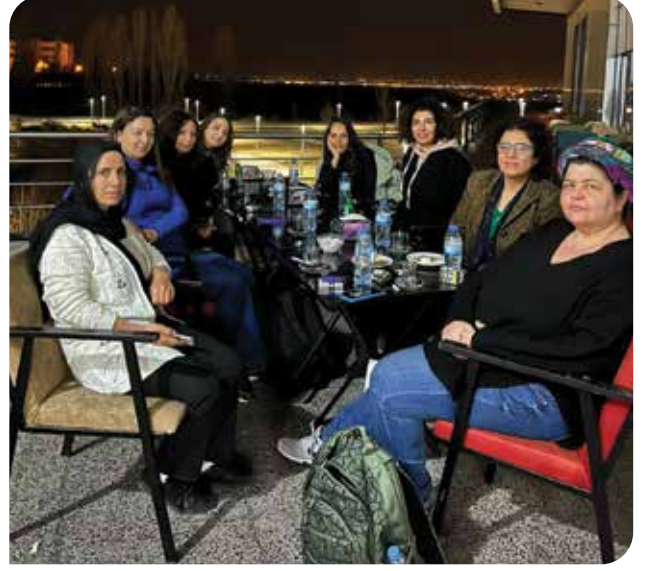
Mart 2023'teki Diyarbakır ziyaretimiz

yaşayan ve Batman'dan gelen KIHEP eğiticilerimiz ile buluşma fırsatımız oldu, onlardan da isteyenlere psikolojik destek sunduk.