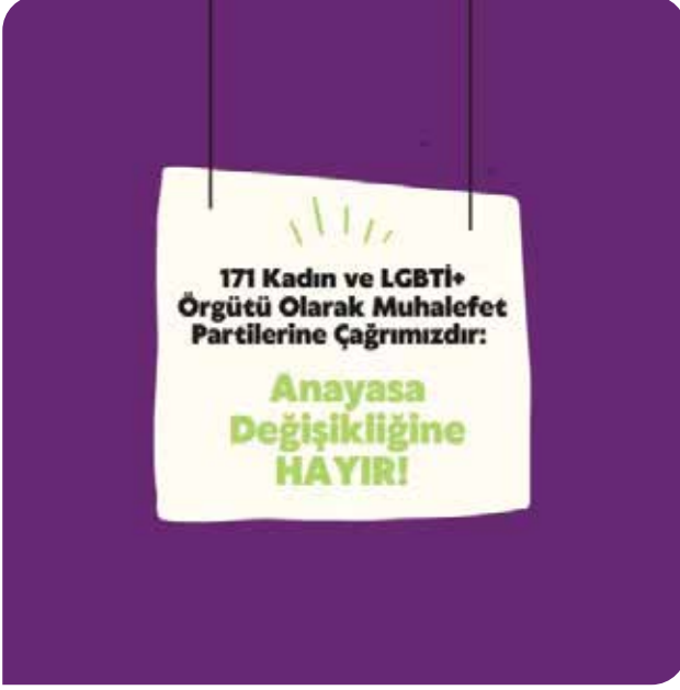
"Anayasa Değişikliğine HAYIR!" kampanyası