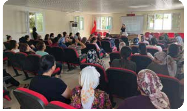
Evvel Temmuz Festivali, Samandağ/Çöğürlü Mahallesi

12 Kasım 2023'te yüz yüze toplumsal cinsiyet eşitliği semineri için ikinci oryantasyon çalışmasını tamamladık. 80'den fazla KİHEP eğiticisinin katıldığı, İstanbul'da gerçekleşen oryantasyonda seminer içeriğini eğiticilerimizle paylaştık ve seminer uygulama stratejileri üzerine konuştuk. Şimdiye kadar yaklaşık 7.000 kişiye ulaşan Toplumsal Cinsiyet Eşitliği Seminer programımızın KİHEP eğiticilerinin de uygulamalarıyla gelecek dönemde on binlerce kişiye ulaşmasını hedefliyoruz.