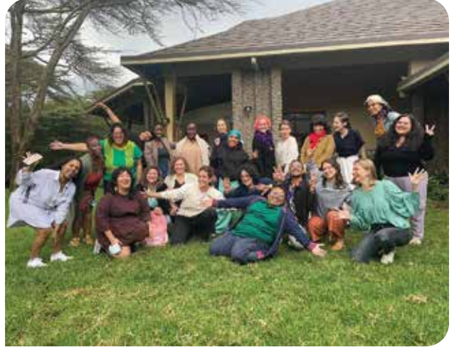
Hakların Evrenselliği Gözlem Evi (OURs) Platformu toplantısı, Naivasha, Kenya

Üyesi olduğumuz ve AWID tarafından sekretaryası yürütülen OURs Platformu olarak pandemiden sonra ilk defa yan yana gelme fırsatı yakaladık. 2-3 Kasım tarihleri arasında Kenya Naivasha'da gerçekleştirilen toplantıda dünyanın dört bir yanından gelen feminist aktivistlerle bir aradaydık. Zoom toplantılarından kurtulup fiziksel olarak yüz yüze konuşmanın herkese çok iyi geldiği toplantıda OURs Platformu'nun son dört yılda yaptıklarını ve yapamadıklarını değerlendirirken küresel olarak yükselen otoriterizmin hayatlarımız ve savunuculuk stratejilerimiz üzerindeki etkilerini tartıştık. Önümüzdeki yıl, savunuculuk bağlamında birlikte yapabileceğimiz, hak karşıtı örgütlenmelere karşı uluslararası alandaki mücadele yöntemlerimiz üzerine kafa yorduk; kolektif güven ve dayanışmanın, birlikte iyileşmenin yollarını bulmaya çalıştık. OURs Platformu olarak yeni dönem stratejimizi bir manifestoyla çok yakında açıklayacağız.