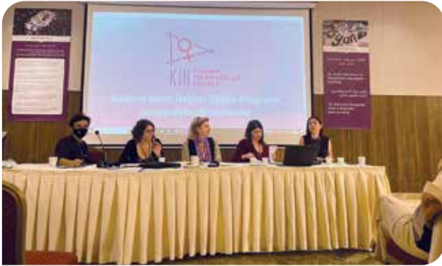
26. Kadın Sığınakları ve Da(ya)nışma Merkezleri Kurultayı, İzmir

çalışmalar, Türkiye'de haklarımıza saldırılar, uygulama sorunları ve önleyici çalışmalar, kadına yönelik şiddeti önlemek için kadınlarla dayanışmak, cinsel sağlık hizmet ve haklarına erişimde koruyucu ve önleyici çalışmalar başlıklarında konuşmalar yapıldı.