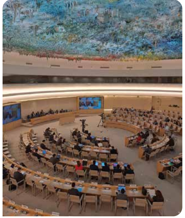
Birleşmiş Milletler İnsan Hakları Konseyi 53'üncü oturumu, Cenevre, İsviçre