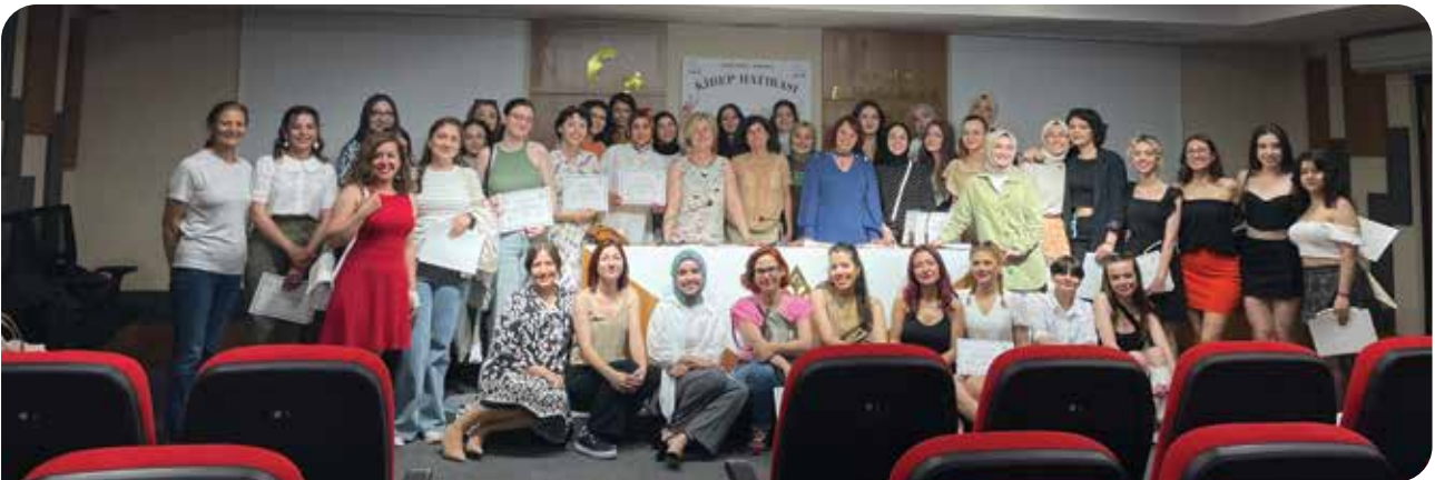
Ankara KİHEP Sertifika Töreni

Ankara KİHEP Sertifika Töreni: SHUDER Genel Merkezi ile Aralık 2022'de imzaladığımız KİHEP İşbirliği Protokolü'nün ardından SHUDER Genel Merkezi bünyesinde başlayan sosyal hizmet öğrencilerine yönelik üç KİHEP grup çalışması için 18 Aralık 2023'te Ankara'da bir sertifika töreni düzenledik. Ankara Barosu'nda düzenlenen KİHEP grubunun katılımcılarının da sertifikalarını aldığı törene yaklaşık 100 kadın katıldı.