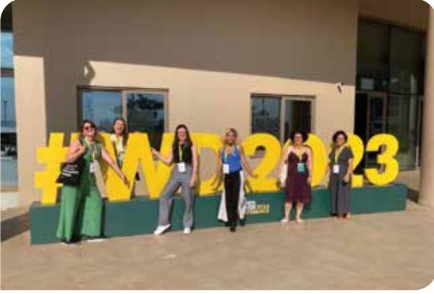
Women Deliver 2023 Konferansı, Kigali, Ruanda