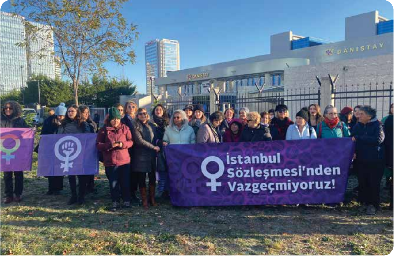
İstanbul Sözleşmesi'nden çekilme kararına karşı Mayıs 2021'de açtığımız davanın tam iki buçuk sene sonra görülen duruşması için 28 Kasım 2023'te Ankara'da Danıştay'daydık