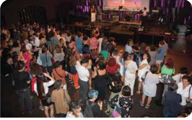
Yıllardır verdiğimiz feminist mücadeleyi Kadının İnsan Hakları Derneği 30. Yıl Gecesi'nde dostlarımızla birlikte kutladık