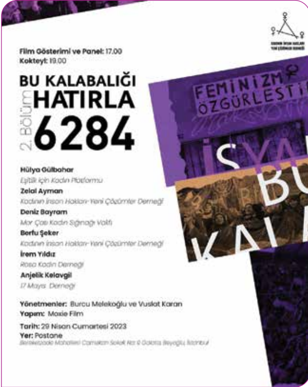
Bu Kalabalığı Hatırla: 6284 belgeselimizin ilk gösterimini Nisan 2023'te yaptık

Belgeseli YouTube kanalımızdan ve web sitemizdeki "Yayınlar" başlığının altındaki "Videolar" sayfamızdan izleyebilirsiniz.