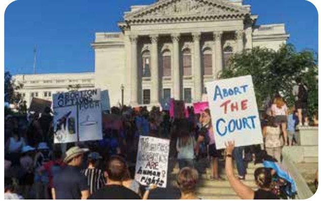
ABD'de ülke çapında kürtaj hakkı eylemleri düzenlendi

Ocak sonunda Almanya Dışişleri Bakanı Annalena Baerbock yaptığı açıklamayla Almanya'nın İstanbul Sözleşmesi'ne koymuş olduğu iki çekinceyi kaldıracağını ve Şubat itibariyle sözleşmenin tam olarak uygulanmaya başlanacağını duyurdu. 13 Sözleşme Almanya tarafından Şubat 2018'de uygulamaya sokulmuş ama sığınmacı ve göçmen kadınlarla ilgili iki maddeye çekince konmuştu. Ülkede sözleşmenin uygulanmaya başlanmasının beşinci yılında bu çekinceler de kaldırılacak. Haberi paylaşan Almanya Dışişleri Bakanı, Avrupa Konseyi Parlamenterler Meclisi'nde yaptığı konuşmada Avrupa Birliği ülkelerini de sözleşmeyi onaylamaya davet etti.