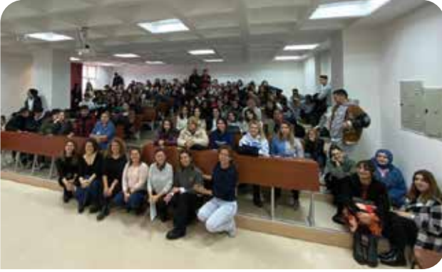
Çanakkale Onsekiz Mart Üniversitesi Çan Meslek Yüksekokulu'da TCE Semineri gerçekleştirdik.