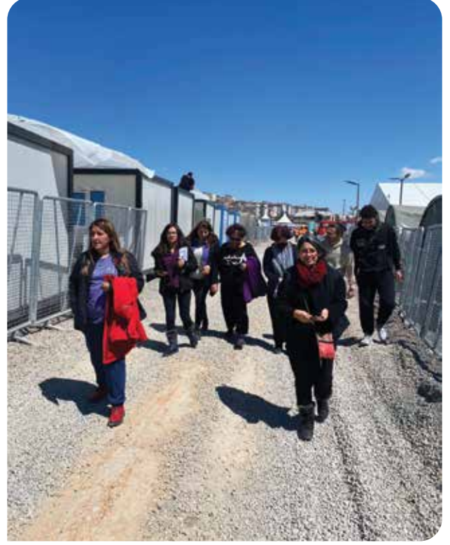
Kadın Koalisyonu Hatay ziyareti