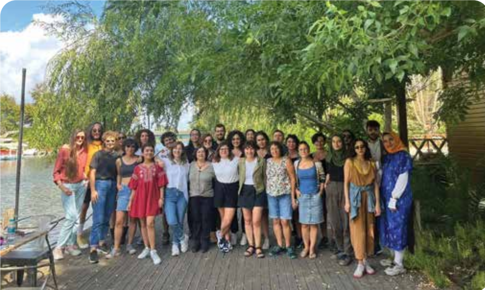
"Haklarımız İçin Bir Aradayız!" çalıştayında 20'den fazla feminist örgüt ve LGBTİ+ örgütü olarak bir araya geldik

15-17 Eylül 2023 tarihlerinde İstanbul'da "Haklarımız İçin Bir Aradayız!" isimli bir çalıştay düzenledik. Çalıştayda Türkiye'nin dört bir yanında faaliyet yürüten 20'den fazla feminist ve LGBTİ+ örgütünden temsilciler olarak, önümüzdeki yeni dönemde haklarımıza yönelecek tehdit ve saldırılara karşı olanaklarımız, kapasitemiz, araçlarımız ve örgütlenme ve yerelden ulusala yeni mücadele stratejilerimiz üzerine birlikte düşünme fırsatı bulduk. Eylül ayının sonlarında çalışmaya katılan 23 farklı kadın, feminist ve LGBTİ+ örgütü ile birlikte toplumsal cinsiyet, LGBTİ+ hakları ve eşitlik karşıtı Anayasa değişikliği çalışmalarına istinaden bir araya gelerek "Hepimiz için Anayasa Koordinasyonu" isimli bir kampanyayı başlattık. Kampanyayı ve kampanya kapsamında üretilen çalışmaları hepimizicinayasa.org sitesinden inceleyebilirsiniz.