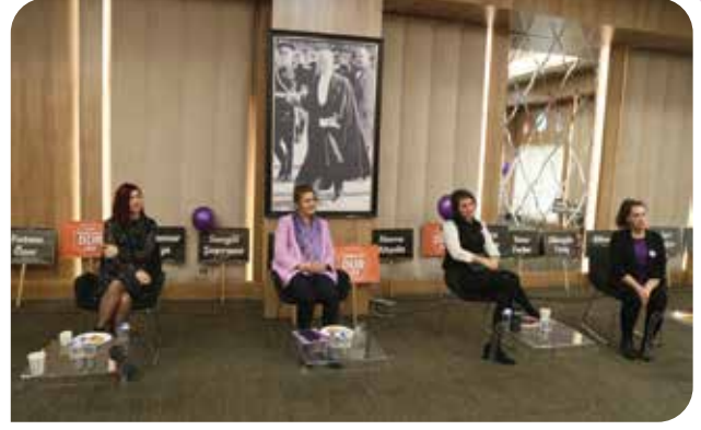
25 Kasım Kadına Yönelik Şiddetle Uluslararası Mücadele ve Dayanışma Günü kapsamında Büyükçekmece Belediyesi tarafından düzenlenen "Şiddete Karşı Mücadele Yöntemleri" söyleşisine katıldık

Üyesi olduğumuz EuroMedRights'ın davetiyle 23-24 Kasım 2023 tarihleri arasında düzenlenen uluslararası feminist festival Talk Town kapsamında "Aktivistler Avrupa-Akdeniz bölgesinde yükselen toplumsal cinsiyet karşıtı hareketlerle nasıl mücadele ediyor?" başlıklı panelde sunum yapmak üzere Danimarka'nın Kopenhag şehrindeydik. Toplumsal cinsiyet karşıtı söylem ve hareketlere karşı Tunus, İspanya, Türkiye ve Danimarka örneklerinin interaktif bir yöntem benimsenerek dinleyicilerin de katılımı ile birlikte tartışıldığı panelde biz de KİH olarak Türkiye'de feminist hareketin toplumsal cinsiyet karşıtı söylem ve politikalara karşı geliştirdiği strateji ve mücadele biçimlerini aktarma ve diğer ülkelerdeki feministleri dinleme fırsatı bulduk.