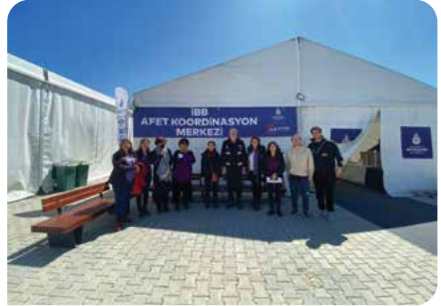
Kadın Koalisyonu Hatay ziyareti

Deprem sonrası göç edilen illerdeki veya deprem bölgesindeki kalabalık olarak sığınılan evlerde ya da çadırlarda da gözlemlendi ki yemeğin hazırlanması, temizlik işleri, çamaşırların yıkanması gibi işler her zamanki gibi kadınlar tarafından yerine getiriliyor. İlerleyen günlerde evlerini, işlerini, yakınlarını kaybetmiş ve hiç planladıkları halde yaşadığı şehirleri değiştirmek zorunda kalmış bu kadınlar, yavaş yavaş sosyalleşme ihtiyaçlarını dile getirmeye başladı. Kurumlarda kalanlar sabahın akşamına kadar hiçbir şey yapmadan oturmaktan sıkıldıklarını belirtirken, evlerde olanlar ise bilmedikleri bir şehirde gelen giden kimseleri olmadığı için sosyalleşme ihtiyaçları olduğunu belirtti.