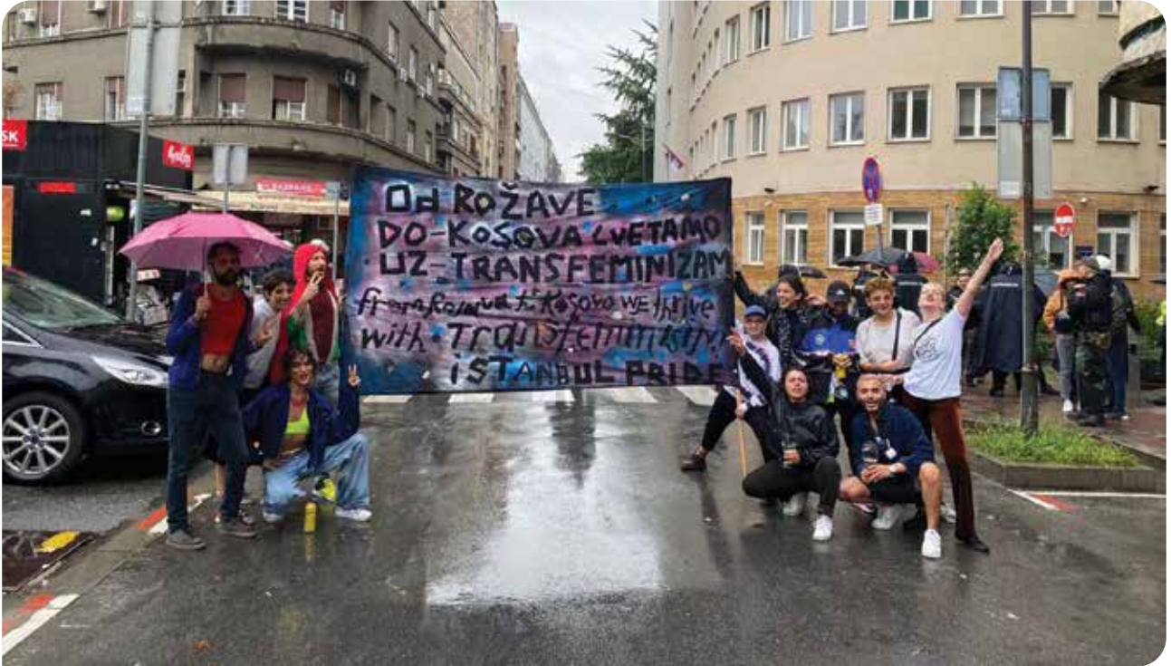
Türkiye'den LGBTİ+ aktivistler de Belgrad'daki EuroPride ve Onur Yürüyüşü'ne katıldı

Eylül sonunda verdiği bir kararda, Hindistan Yüksek Mahkemesi, medeni durumuna bakılmaksızın ülkedeki tüm kadınların 24 haftaya kadar kürtaj yaptırabileceğine