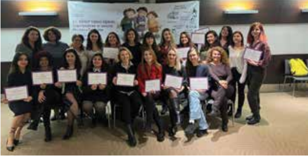
12. KİHEP Eğitici Eğitimi'ni tamamlayan KİHEP eğitimcileriyle birlikte bir değerlendirme ve planlama toplantısı gerçekleştirdik