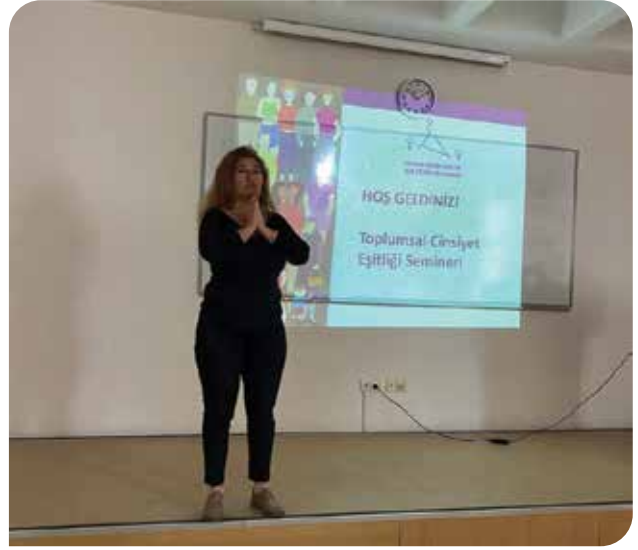
Toplumsal Cinsiyet Eşitliği Seminerleri devam ediyor

KSK oturumuyla ilgili gelişmeleri derlediğimiz bir mail hazırlayarak kadın hareketi içerisinde yaygınlaştırdık. KİH-YÇ ve Kadın Koalisyonu olarak Pekin+25 Kadın Platformu çerçevesinde "Küresel Bağımsız Feminist Bir Yapı" başlığı altında çevrimiçi bir paralel etkinlik düzenledik. 2019'dan beri tartışmaya açtığımız bu kurumun tahayyülü etrafında