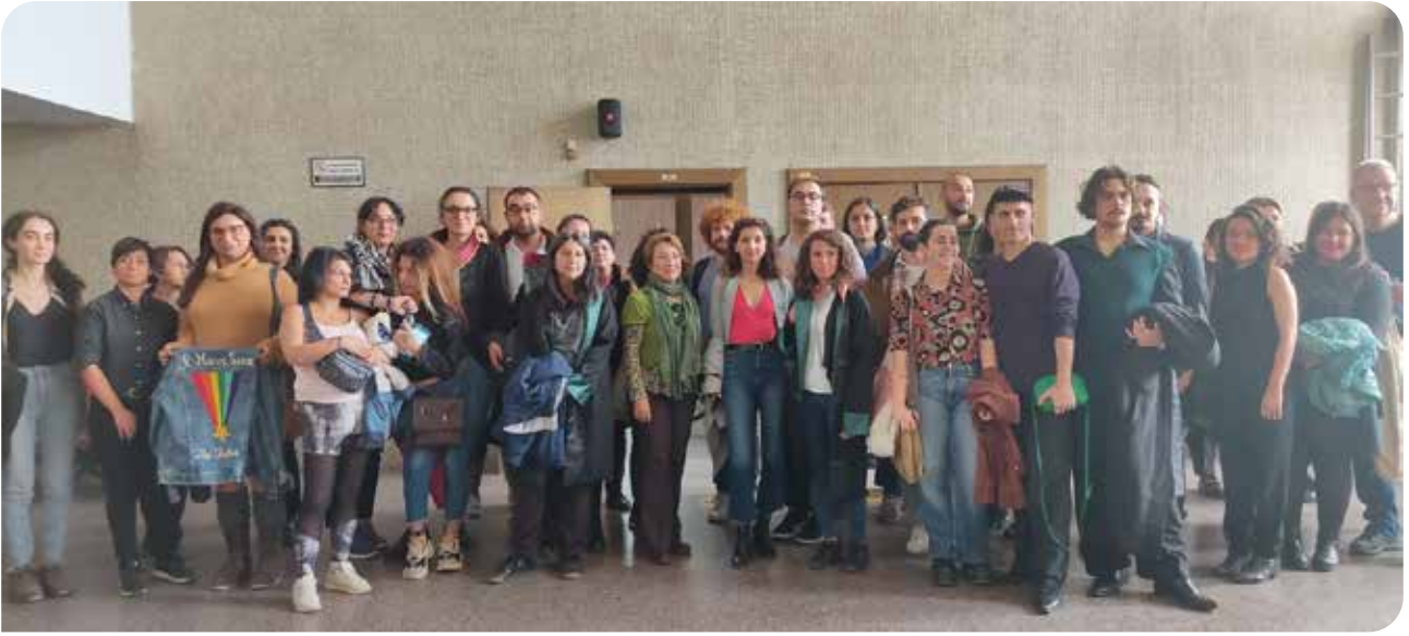
Eryaman-Esat davası: Savcı'nın talebiyle yeniden bilirkişiye gidecek