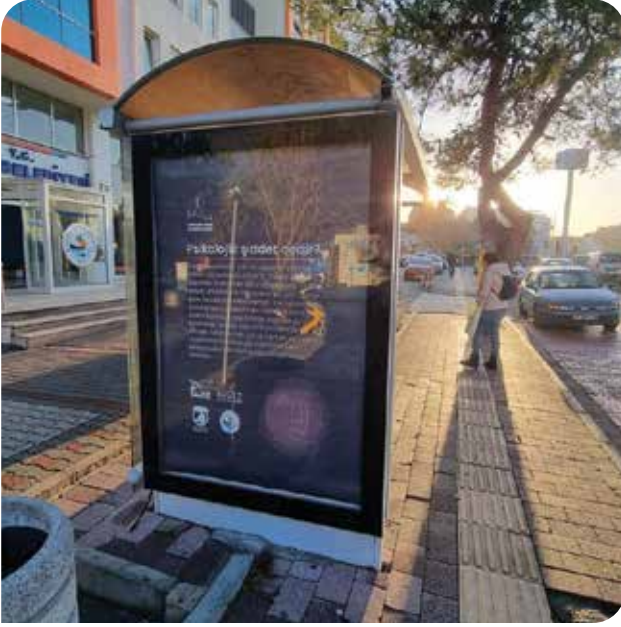
Erkek şiddetine dair hazırladığımız bilgilendirici içerikler ELDER, Kepez Özgür Kadın Dayanışması, Çanakkale Belediyesi ve Kepez Belediyesi desteğiyle sokaklardaydı

30 Kasım – 2 Aralık 2022 tarihleri arasında 12. KİHEP Eğitici Eğitimi'ne katılan eğitimcilerimizle bir araya geldik. Son bir yıllık süreci değerlendirdiğimiz, KİHEP'i daha fazla kadına ulaştırabilmek için stratejilerimizi belirlediğimiz toplantıda, ilk grup çalışmalarını tamamlayan arkadaşlarımıza KİHEP eğitici belgelerini teslim ettik.