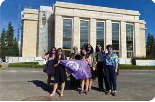
KİH-YÇ olarak Türkiye'nin 8'inci Gözden Geçirmesi için Cenevre'de gerçekleştirilen CEDAW oturumundaydık

üzerinden açılan davalardan haberdar olduğunu ifade etti. Ayrıca devletin politika belgelerinden toplumsal cinsiyet kavramının çıkarılmasına ve Türkiye'de LGBTİ+'ları koruyacak bir yasanın olup olmadığına dair sorularını yönelttiler. Bakan Derya Yanık Komite'den LGBTİ+ haklarına yönelik gelen ısrarlı sorulara "Anayasanın 10. maddesi LGBTİ+'ları da korur, LGBTİ+'lar Türkiye Anayasası altında koruma altındadır, tüm yasalar anayasaya uygun olmak durumundadır." şeklinde cevap verdi.