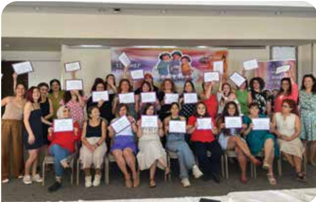
13. KİHEP Eğitici Eğitimi'ni 12-25 Eylül 2022 tarihlerinde gerçekleştirdik

Böylece, KİHEP Eğitici Eğitimlerinden yararlanan kişi sayısı 300'ü aştı ve bu yolla KİHEP'i yerelde uygulayacak olan program ortaklarımızın sayısı da artmış oldu.