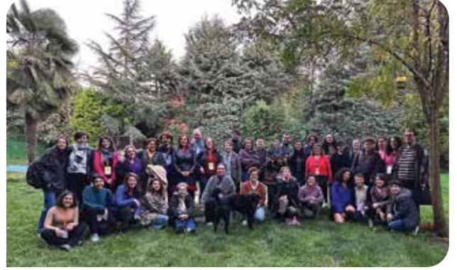
KİH-YÇ ve Kaos GL olarak 2019’dan beri gerçekleştirdiğimiz ODOS etkinliklerinden bu sene İstanbul’da düzenlediğimiz ve LGBTİ+ örgütleri ile insan hakları örgütlerinden 38 kişinin katıldığı Dayanışma Yaşatır Forumu’ndan dayanışmanın verdiği güçle ayrıldık

Bu kapsamda gerçekleştirdiğimiz forumu üç ana başlık etrafında kurguladık. İlk oturumda yoksulluk ve ekonomik krizin etkilerini, ikinci oturumda “güçlü aile” söylemi üzerinden iktidarın hayatlarımız, bedenlerimiz ve emeğimiz üzerinde kurmaya çalıştığı tahakkümü, son oturumda da bizi görmezden gelen muhalefetin ve dışlayıcı siyasetin karşısında taleplerimizin neler olduğunu birbirimizden güç alarak başka bir dünyanın imkanları üzerine konuştuk. Forumun ilk oturumunda, patriyarkaya