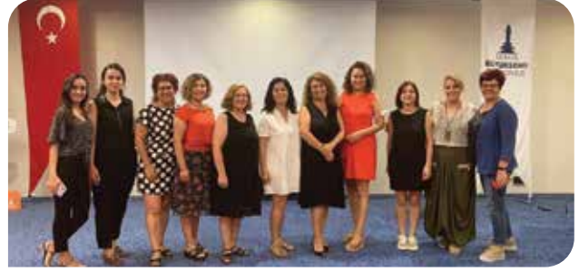
İzmir Su ve Kanalizasyon İdaresi Müdürlüğü iş birliğiyle gerçekleştirdiğimiz Toplumsal Cinsiyet Eşitliği Seminerleri'ne 80 kişi katıldı

Kadının İnsan Hakları – Yeni Çözümler Derneği olarak Mor Çatı ve Women on Web ile birlikte Türkiye'de kürtaj hizmetlerine erişime yönelik geliştirdiğimiz projenin detaylarını ilerleyen günlerde sizinle paylaşacağız.