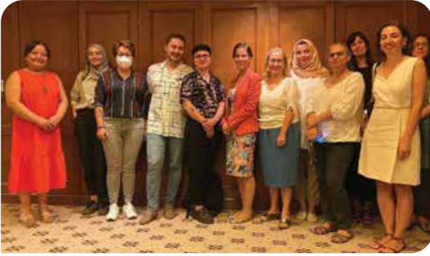
Birleşmiş Milletler Kadınlara ve Kız Çocuklarına Yönelik Şiddet, Sebepleri ve Sonuçları Özel Raportörü Reem Alsalem ile bir araya geldik

Avrupa Kadın Lobisi tarafından organize edilen ve insan hakları örgütleri ve kadın hakları örgütlerinden temsilcilerin yer aldığı toplantıda Avrupa Konseyi Parlamenter Meclisi Kadına Yönelik Şiddet ve İstanbul Sözleşmesi Raportörü Zita Gurmai ile bir araya geldik. Raportöre çalışmalarımız hakkında bilgi vermenin yanı sıra İstanbul Sözleşmesi'nden çekilme sonrası uygulamadaki güncel durum ve toplumsal cinsiyet eşitliğine yönelik saldırılar hakkında bilgi ve deneyim aktarımında bulunduk.