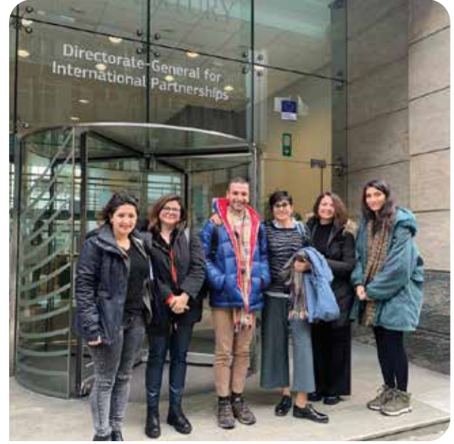
Çalışma ziyareti için CİSÜ Platformu ile Brüksel'deydik

Geçtiğimiz sene 25 Kasım Kadına Yönelik Şiddete Karşı Uluslararası Mücadele Günü'nü de içinde barındıran kasım ayı boyunca sosyal medyada paylaşmak üzere hazırladığımız erkek şiddetine yönelik bilgilendirici içeriklerimizi farklı formatlarda yaygınlaştırmaya devam ettik. ELDER, Kepez Özgür Kadın Dayanışması, Çanakkale Belediyesi ve Kepez Belediyesi desteğiyle “Erkek Şiddeti Nedir?” içeriklerimiz Kepez ve Çanakkale'nin merkezindeki otobüs duraklarında ve raketlerde yer aldı.