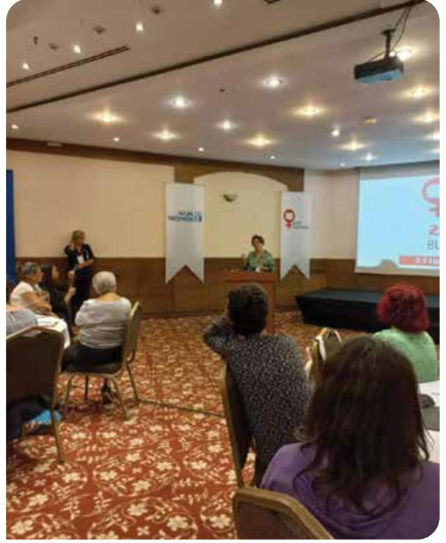
Kadın Koalisyonu'nun bileşenleri olarak koalisyonun 20. yaşını kutlamak için bir araya geldik

Açılış konuşmalarının ardından Kadın Koalisyonu bileşenleri kısa sözler olarak koalisyon ile birlikte örgütlenme ve çalışma deneyimlerine ilişkin aktarımda bulundu. Toplantıya katılmayan bileşen temsilcilerinin 20. Yıl Buluşması için hazırladığı videolar hep birlikte izlendi. Daha sonra Kadın Koalisyonu'nun çalışma grupları vasıtasıyla yürüttüğü kampanya ve çalışmalar hakkında kısa sunumlar yapıldı. Bu kapsamda Kadın Koalisyonu'nun izleme çalışmalarının bir parçası olarak yürütülen Zor Zamanlarda Kadın Olmak adlı raporun hazırlık süreci, belediyelere yönelik izleme çalışmaları, iç güvenlik ve seçim yasası konularında yapılan çalışmalar ile ilgili aktarım yapıldı ve İstanbul Sözleşmesi'nden çekilme bildirimine üzerine Kadın Koalisyonu'nun yürüttüğü kampanyaya ilişkin bilgi verildi.