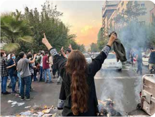
İran’da Mahsa Amini’nin polis tarafından öldürülmesinin ardından başlayan eylemler devam ediyor

2022 yılının ikinci yarısına damgasını vuran 22 yaşındaki Kürt kadın Mahsa Amini’nin “ahlak polisi” olarak bilinen irşad devriyeleri tarafından başörtüsünü düzgün takmadığı gerekçesiyle Tahran’da gözaltına alınarak öldürülmesinin ardından İran ’da kadınların başlattığı ve ülkenin her yerine yayılan uzun soluklu direniş oldu. Protestocuların sokaklarda öldürülmesine varan yoğun polis şiddeti ve her türlü baskıya rağmen kadınların başını çektiği eylemlerle İran halkı özgürlükleri için verdikleri ısrarlı mücadeleden vazgeçmiyor. Norveç merkezli İran İnsan Hakları Örgütü’nün (IHR) açıklamasına göre 16 Eylül’den bu yana devam eden protestolarda yaşamını kaybedenlerin sayısı 22 Kasım itibarıyla 416. 1 Öldürülenler arasında çocuklar da var. Kasım ayının ilk yarısında çeşitli kaynakların paylaştığı sayılara göre, 15 bine yakın kişi protestolara katıldıkları gerekçesiyle tutuklu. 2 Asıl sloganı “Jin Jiyan Azadi” (Kadın Yaşam Özgürlük) olan eylemlere dünyanın her yerinden kadınlar destek vermeye, aralarında Türkiye, Almanya ve İtalya’nın da bulunduğu ülkelerde kalabalık katılımlı dayanışma eylemleri düzenlenmeye devam ediyor.