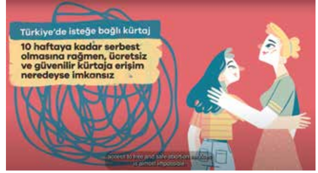
Kadınların Üreme Sağlığı Hizmetleri ve Kürtaj Deneyimleri araştırmasında öne çıkan bulgulardan derlediğimiz videodan bir kare