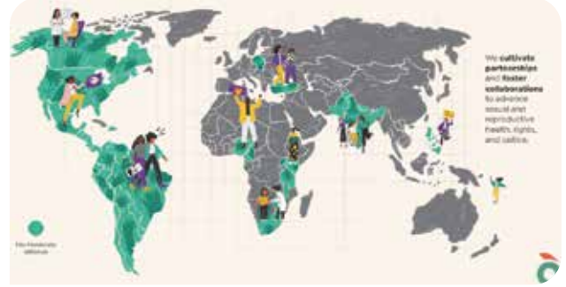
Dünyanın birçok yerinde Fòs Feminista bileşeni feminist örgüt bulunuyor

Fòs Feminista, kadınların, genç kızların ve cinsiyet çeşitliliğine sahip kişilerin cinsel sağlığı ve üreme sağlığı ve hakları merkezli çalışmalara odaklanan kesişimsel bir feminist örgüt. Birlik içinde 40'tan fazla ülkede aktivizme odaklanan 220'den fazla örgüt bulunuyor. Birlik, dünyanın dört bir yanındaki yerel ortaklarıyla birlikte, cinsel sağlık ve üreme sağlığı hizmetlerinin sağlanması ve bu hizmetlerin kadın ve kız çocukları için daha erişilebilir hale getirmeyi amaçlayan toplum temelli stratejilerin uygulanmasını da içeren sağlık, eğitim ve savunuculuk faaliyetleri yürütüyor. Ayrıca Fòs Feminista, eşitsizliğe ve adaletsizliğe direnen yerel ve küresel olarak toplumsal cinsiyet eşitliğini ve üreme haklarını savunmak için feminist sesini sokaklarda, mahkemelerde ve diğer savunuculuk alanlarında yükselten tüm ortaklarının yanında yer alıyor. Birlik ayrıca kendini, tüm dünyada hak temelli çalışmalar için giderek büyüyen bir tehdit olarak karşımıza çıkan hak karşıtı ve toplumsal cinsiyet karşıtı gruplarla mücadelede feminist hareketler için transnasyonal bir köprü olarak konumlandırıyor.