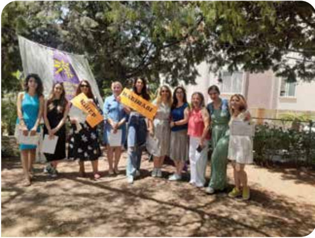
KİHEP grup çalışmaları birçok ilde sürüyor

13-15 Haziran tarihleri arasında gerçekleşen Türkiye oturumunu 20 kadın ve LGBTİ+ örgütünün oluşturduğu CEDAW Sivil Toplum Yürütme Kurulu bünyesinde komiteye sunduğumuz gölge rapor ve sözlü bildiri ile aktif bir şekilde takip ettik.