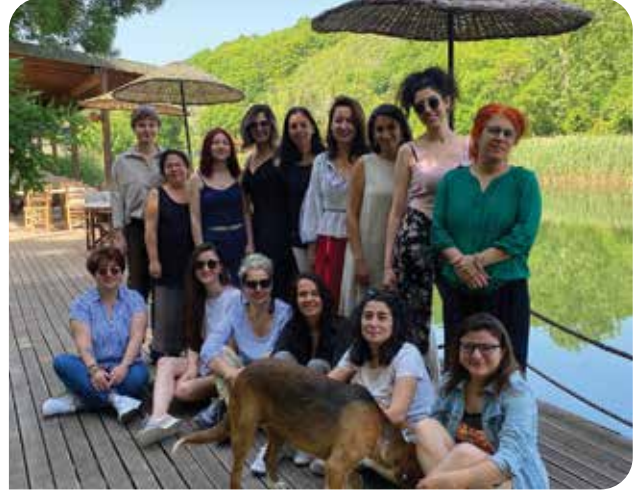
İkinci ekip kampını Mayıs 2022’de Ağva’da gerçekleştirdik

“Aile içi şiddet ve kadına karşı şiddetle mücadelenin etkinliğinin artırılması amacıyla hazırlandığı” duyurulan 2/4290 sayılı Türk Ceza Kanunu ve Bazı Kanunlarda Değişiklik Yapılmasına Dair Kanun Teklifi 16 Mart 2022 tarihinde oylanarak kabul edildi. Az sayıda olumlu adım içermekle birlikte genel olarak değerlendirildiğinde söz konusu kanun değişikliğinin, şiddetle mücadele amacını karşılamaktan çok uzak olduğunu görüyoruz. Değişikliklerin toplumsal cinsiyet temelli şiddetle mücadeledeki sorunları çözebilecek nitelikte olmadığı, aksine uygulamada var olan sorunları sürdüreceği ve hatta yeni sorunlar ekleyebileceği, bazı madde değişikliklerinin ise hiç yapılmaya dahi aynı sonucu doğuracak nitelikte olduğunu tespit ettiğimiz bilgi notuna web sitemizdeki “Haberler” başlığından ulaşabilirsiniz.