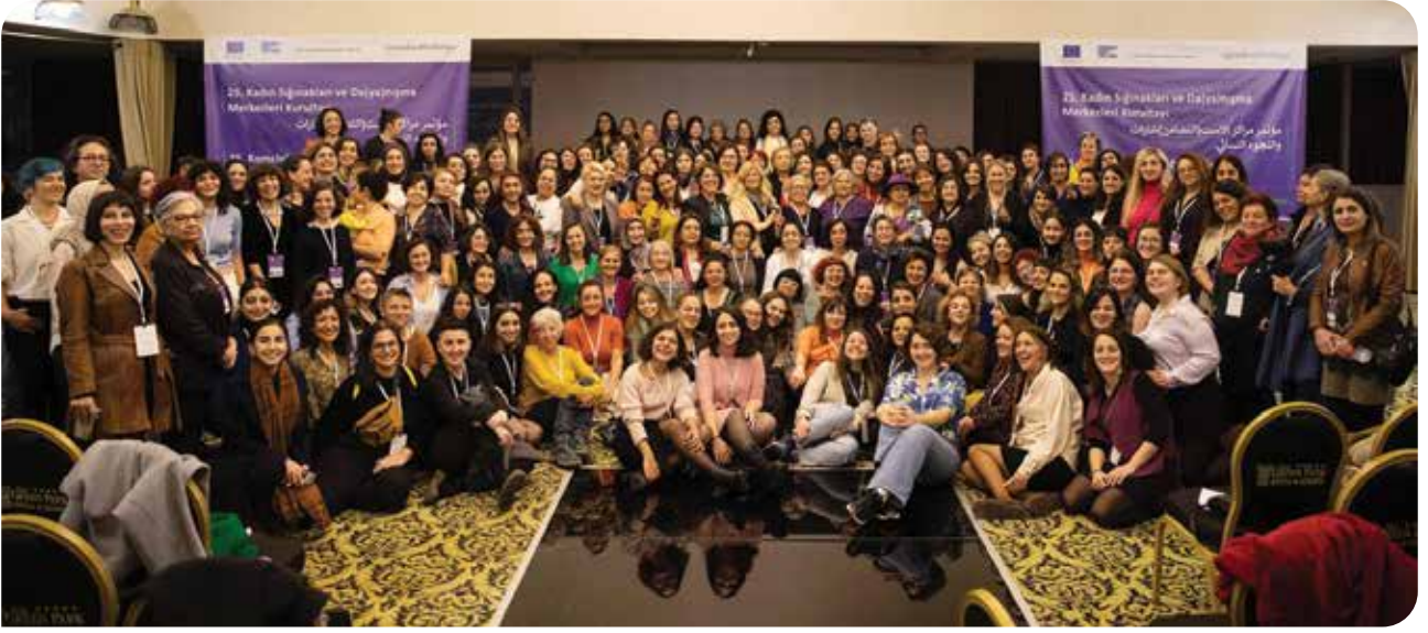
25. Kadın Sığınakları ve Da(ya)nışma Merkezleri Kurultayı bu sene 12-13-14 Kasım tarihlerinde Diyarbakır'da Rosa Kadın Derneği'nin ev sahipliğinde gerçekleşti