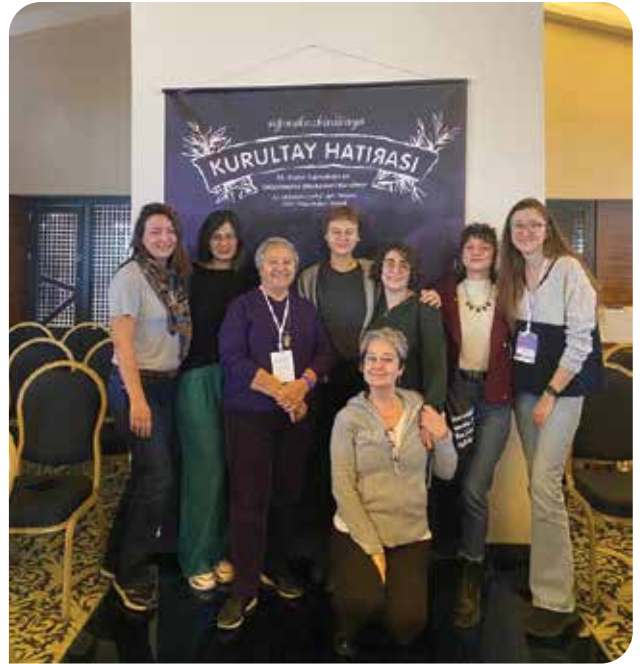
Pandemi nedeniyle uzun süredir göremediğimiz arkadaşlarımızla 25. Kadın Sığınakları ve Da(ya)nışma Merkezleri Kurultayı'nda bir araya geldik ve feminist gündemlerimizi konuşma fırsatı bulduk

"Aile Odaklı Devlet Politikaları Kadına Yönelik Erkek Şiddetiyle Mücadeleyi Nasıl Güçsüzleştiriyor?" başlığıyla gerçekleşen kurultayın yürüttüğü tartışmayı ve bu tartışmadan çıkan talepleri sizlerle doğrudan paylaşmayı önemli buluyoruz. Aşağıda kurultayın sonuç metnine yer veriyoruz.