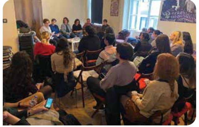
11. KuirFest kapsamında belgeselimiz Bu Kalabalığı Hatırla: İstanbul Sözleşmesi'nin gösterimi ardından bir söyleşi gerçekleştirdik

Hazırladığımız bilgi notuna web sitemizden ulaşabilirsiniz.