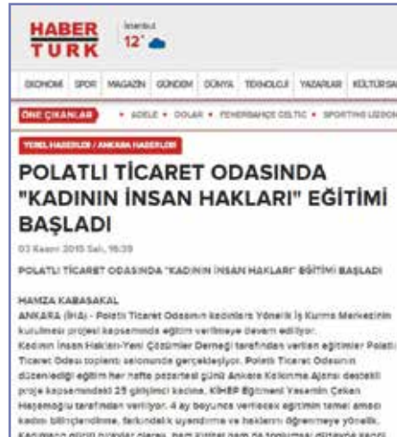
Yasemin Çakan'ın yeni grubuna dair haber haberturk.com.tr sitesinden alınmıştır.