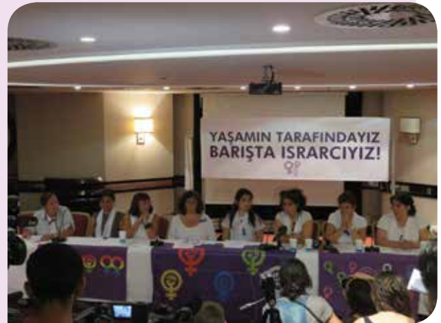
1 Eylül Barış Günü'nde kamuoyuyla Ortak Barış Deklarasyonu'nu paylaştık.

Sonbaharın gelmesi ile birlikte ise yeni KİHEP grupları açılmaya başladı. Her ne kadar Aile ve Sosyal Politikalar Bakanlığı hala yürürlükte olan protokolümüze rağmen programa artık destek vermiyor olsa da başta belediyelerin desteği ile gruplar açılmaya devam ediyor. Biz de belediyelerle ilişkilerimizi geliştirmeye önem veriyoruz ve bu çerçevede yeni işbirlikleri geliştirmek için çalışıyoruz. Önümüzdeki dönemde size bu konuda güzel haberler vermeyi umuyoruz.