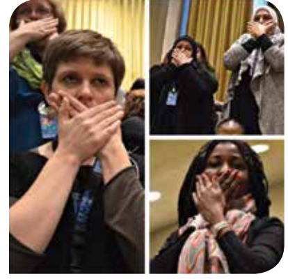
Kadınlar, KSK 59. Oturumunda siyasi deklarasyonun onaylandığı esnada kadın örgütlerinin süreçten dışlanmasını ve böylece seslerinin kısılmaya çalışılmasını protesto ettiler.

konuşmacı olarak Bakanlık ve uluslararası kurumların temsilcilerinin yanında sadece iki sivil toplum örgütüne yer verilmişti: Kadın ve Demokrasi Derneği (KADEM) ile Türkiye Gençlik ve Eğitime Hizmet Vakfı (TÜRGEV).