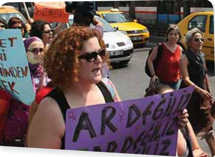
Kadınlar Galata Köprüsü'nde eylemde

Bu yaz Galata Köprüsü'nde balık tutan bir kadın, köprüdeki bazı erkeklere göre "genel ahlaki" rencide ettiği için "hayâsızlık suçu"ndan 5 ay hapis cezasına çarptırıldı! Kararı protesto etmek için Galata Köprüsü'ne yürüyen kadınlar tek bir mesaj verdi: