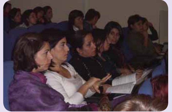
Öyle çok tanıdık yüz vardı ki: Kurultaya yaklaşık 30 KİHEP'li kadın katıldı.