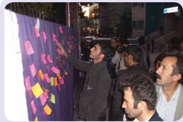
Beze asılı talepler çevredeki erkeklerden büyük ilgi gördü.

Kurultay sırasında yapılan basın açıklaması yerel basında geniş yer buldu. Kadınların yanlarında getirdikleri bezlerin üzerine oturarak gerçekleştirdikleri "Dünyada bir yer istiyoruz" başlıklı eylem, Van'daki en kalabalık kadın eylemlerinden biri oldu.