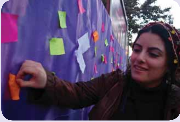
Kadınlar sokakta duvara çektikleri mor bezin üzerine taleplerini astılar.

Kadına yönelik şiddete karşı sığınak ve dayanışma merkezi faaliyeti yürüten bağımsız kadın grupları, belediyeler, SHÇEK çalışanları, üniversitelerin ilgili bölüm temsilcileri ve feminist kadınlar, Ekim ayında Van'da buluştu. Van Kadın Derneği'nin (VAKAD) özverili ev sahipliğinde gerçekleştirilen 11. Kadın Sığınak ve Da(ya)nışma Merkezleri Kurultayı'na yaklaşık 130 kadın katıldı.