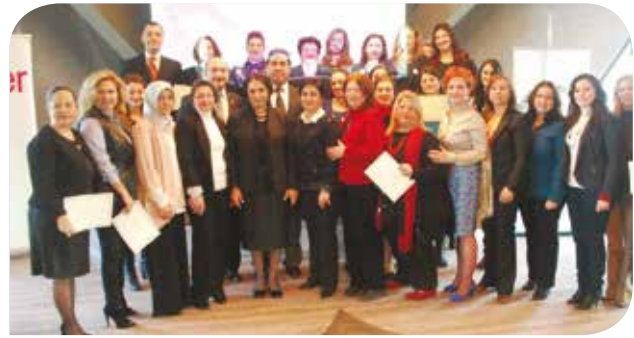
KİHEP'li Kadınlar

Mor Salkım Kadın Dayanışma Derneği; genel merkezi Bursa olan, 27 Nisan 2012 tarihinde kadın hakları aktivistlerince kurulmuş bir sivil toplum kuruluşudur. Kadın ve kız çocuklarına "Yalnız değilsiniz!" çağırısı ile destek veren Mor Salkım Kadın Dayanışma Derneği, şiddet mağdurlarına 7 gün, 24 saat hizmet veren telefon hattının ucundaki bir ses ile kadınlara güç veriyor ve alanlarında profesyonel üyelerinin katkılarıyla kadınlara sağlanan hukuki ve psikolojik destekle özel danışma merkezi niteliğinde hizmet veriyor. Şiddet mağduru, kadın sığınma evinde kalan ve sığınma evinden çıkarak hayatını kurtmaya çalışan kadınlara destek olan Mor Salkım Kadın Dayanışma Derneği birçok kurum ve kuruluş ile de işbirliği içinde çalışıyor. Sosyolog, psikolog, hukukçu ve kadın hakları aktivistlerinden oluşan dernek profili ile yüzlerce gönüllüye sahip dernek; kurulması üzerinden çok kısa süre geçmesine rağmen sahada birçok çalışmaya imza attı.