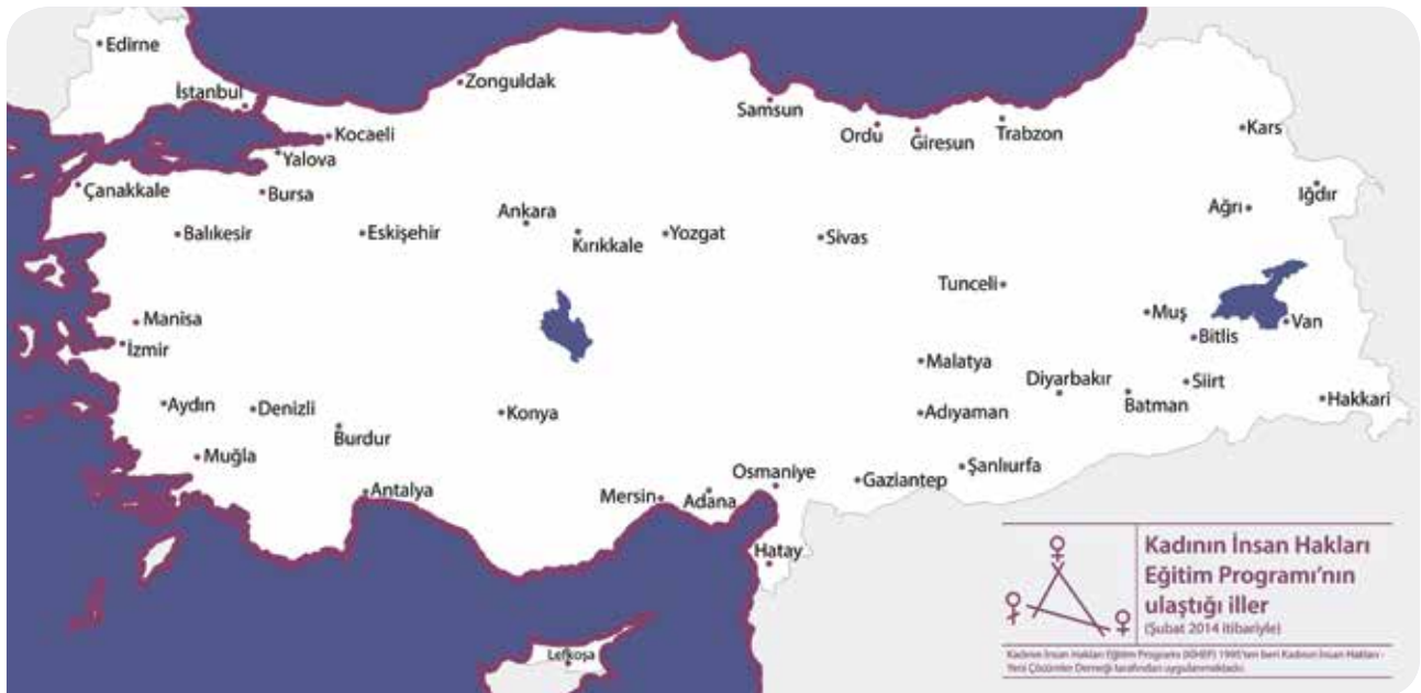
KİHEP'in Uygulandığı İller Haritası