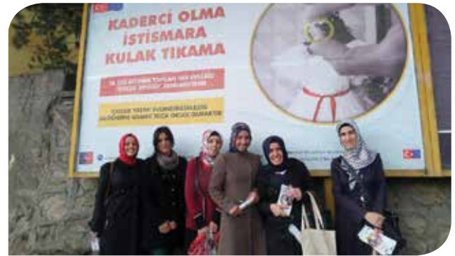
Muş Kadın Çatısı Derneği'nin, "Çocuk evliliklerine karşı" başlattığı kampanyanın alan çalışması. (Muş Kadın Çatısı Arşivinden - 2014)