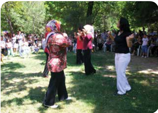
Truva Toplum Merkezi'nin KİHEP grubu folklor gösterisi yapıyor. Kavga ve şiddet yerine dans ve müziği kullanan bu şahane kadınlar, Merkezimizin gururu oldular.