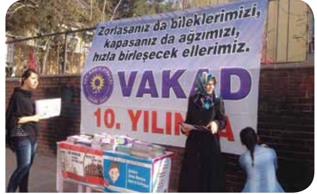
2014 yılı aynı zamanda VAKAD'ın kuruluşunun 10. Yılı. VAKAD'a uzun bir ömür diliyoruz...

Kadınların kürtaj ya da sezaryen yapmaması için devletin yeni yasalar çıkardığı ve kadınlara en az üç çocuk doğurmaları için baskı yaptığı, televizyonlarda hamile kadınların dışarı çıkmaması gerektiğiyle ilgili duyurular yapılan bir ortamda kadınlara karşı gerici bir anlayış giderek büyüyor. Türkiye genelinde sırf kadın olduğundan dolayı kadının yaşadığı sıkıntılar Doğu Anadolu Bölgesi'nde daha yoğun hissediliyor. Yıllardır yapılan ayrımcılık nedeni ile bölgede insanlar