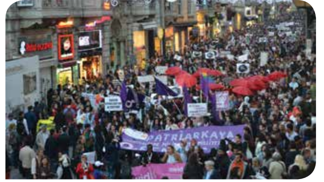
2012 yılında İstanbul'da gerçekleştirilen AWID Uluslararası Feminist Forum'da buluşan kadınların yürüyüşünden bir kare

AWID, KİH-YÇ'nin Türkiye'de ve dünyada kadının insan haklarının sağlanması için çalıştığı 20 seneyi en içten dilekleriyle kutluyor! Farklı düzeylerde ve bağlamlarda çalışan bu iki feminist örgütün işbirliği, toplumsal cinsiyet eşitliğini sağlamaya yönelik savunuculuk faaliyetlerindeki dayanışmanın kadın hareketine kattığı güç konusunda çok iyi bir örnek teşkil ediyor. KİH-YÇ'ye ve tüm kadınlara, toplumsal cinsiyet eşitliğinin sağlanması alanındaki mücadelelerinde başarılarının devamını diliyoruz.