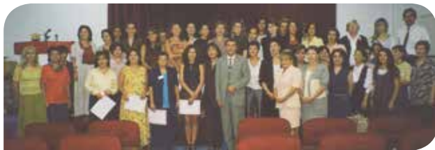
Kadının İnsan Hakları - Yeni Çözümler Derneği ilk Eğitici Eğitimi fotoğrafı.

2000'li yıllardan itibaren Derneğin "üret ve sürdür" ve "gözden geçir ve yenile" aşamalarını takip ettiğini söyleyebiliriz. KİH-YÇ bir yandan üretmeyi sürdürmeye, gözden geçirmeye ve yenilenmeye devam ederken, dönem dönem hem maddi hem de insan kaynaklarındaki kısıtlar altında sancılı dönemler de geçirdi. Kimimiz diğer şehir veya ülkelerdeki kadın örgütleriyle çalışmak, kimimiz farklı çalışma alanları denemek için tam zamanlı ekipten ayrılsak da çoğumuz bağlarımızı hiç koparmadık, zaman içerisinde ekip giderek