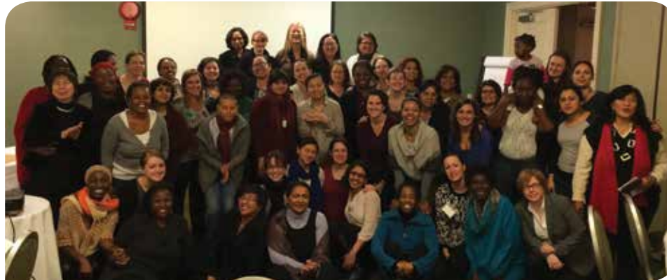
Feminist Strateji Toplantısı (KİH-YÇ Arşiv - Şubat 2014)

çerçevesinde oluşturulacak olan Sürdürülebilir Kalkınma Hedefleri'nin arasında tek başına bir hedef olarak yer alması gerektiğini düşündüğümüz "Toplumsal Cinsiyet Eşitliği" hedefi, son günlerde artık birçok dokümanda yer alıyor. Bu algının bizler için son derece sevindirici bir gelişme olmasının yanı sıra, Kadının İnsan Hakları - Yeni Çözümler Derneği ekibinin de dünya çapında büyük bir başarısı.