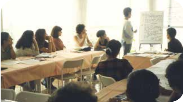
KİHEP Eğitiminin ilk yıllarından

Sosyal Hizmetler ve Çocuk Esirgeme Kurumu ve Kadının İnsan Hakları-Yeni Çözümler Derneği arasında, 1998 yılında imzalanan protokol ile Toplum Merkezleri'nde uygulanmaya başlayan KİHEP'le 2001 yılında tanıştım ve 2010 yılının sonuna kadar 9 yıl boyunca SHÇEK Aile ve Toplum Hizmetleri Şube Müdürlüğü'nde programın koordinatörlüğünü yaptım. Mor Bülten'in bu özel sayısına ne yazabilirim diye düşünürken, önce çok güzel anıları hatırladım. Değerlendirme toplantılarında tüm KİHEP uygulayan arkadaşlarla