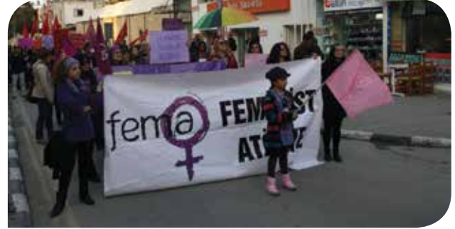
Ceza Yasası değişikliği kampanyasına destek veren Feminist Atölye aktivisti kadınlar

yanında homofobik tepkiler de aldık. Özellikle kendini Kıbrıs Türk-İslam Cemiyeti gibi isimlerle konumlandıran muhafazakâr kesimler eşcinselliğin aslında sapıklık, anormallik, doğaya aykırı bir durum olduğunu söyleyerek, ciddi bir nefret söylemini yaygınlaştırdılar. Başta Feminist Atölye olmak üzere bu alanda çalışan sivil toplum örgütlerinin, oldukça dirayetli durarak gelen olumsuz tepkilerin niye yanlış olduğunu çok iyi açıkladıklarını düşünüyorum.