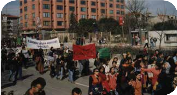
KİHP olarak katıldığımız 8 Mart eylemi.

İlk stratejimiz ulusal düzeyde şekillendi: Çabamızı, Türkiye sınırları dâhilinde farkındalık yaratmak, politik bir hareketin inşasını sağlamak ve yerel/ulusal düzeyde savunuculuk faaliyetleri yürütmek alanlarında yoğunlaştırdık. İşe diğer kadın örgütlerine ulaşarak başladık; Mor Çatı ve diğer birçokları ile işbirlikleri kurduk. Savunuculuk çalışmalarımıza olumlu yanıtlar verecek ortaklar bulmak amacıyla o zamanlar Kadından Sorumlu Devlet Bakanlığı'na, Sağlık Bakanlığı'na ve diğer farklı hükümet organlarına ulaştık. Kadınların uğradığı insan hakları ihallerini araştırmaya, belgeler toplamaya ve savunuculuk faaliyetleri yürütmeye devam ettik. Kadına yönelik şiddet ve kadının aile içindeki karar alma gücü konularında bir araştırma projesi üstlendik.