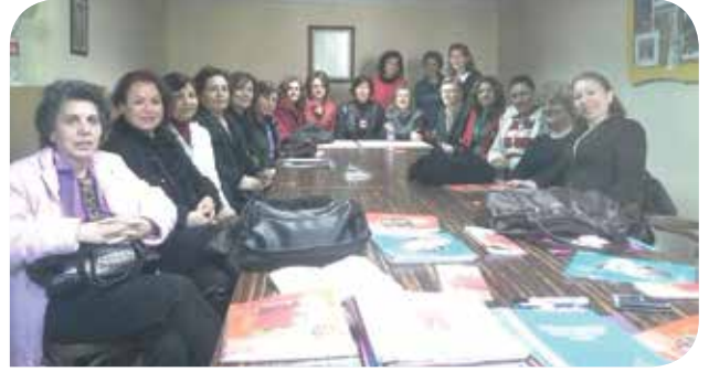
KİHEP grup fotoğrafı

Marmaris'te, KİHEP'i sevgili Gülşah'tan devraldığımında havalara uçmuştum. Toplumda her şeyi eleştiren ama "tut şunun ucundan" dediğinde ortadan kaybolan insanlardan olmak istemiyordum. Evet, benim de elimi taşın altına koyma fırsatım çıkmıştı. Gruplarda bunun kolay olmadığını, yaşayarak öğrendim. Kadına önce kendi değerini fark etmesini, toplumdaki önemini, ekonomik, sosyal, kültürel anlamda aldıklarını ve verdiklerini anlatmak önceleri zorlandığım konulardı. Şu anda 11'inci KİHEP grubum devam ediyor. İlk geldiklerinde ürkek,