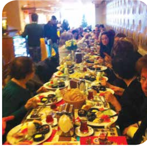
3 Ocak 2014'te İzmir'de düzenlenen KİHEP'li kadınlar kahvaltısı