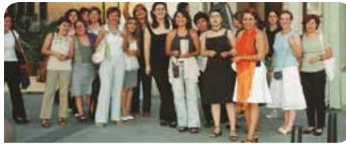
KİHEP’li kadınlar buluşması.

Benim KİH-YÇ ile tanıştığım 2002 yılında ise, Dernek birçok öncü araştırma ve savunuculuk kampanyası, yayın ve bilinç yükseltme çalışmasına imza atmış, faaliyetlerini tüm hızıyla sürdürüyordu. Türk Medeni Kanunu kadınların yürüttüğü kampanya sonucunda yeni