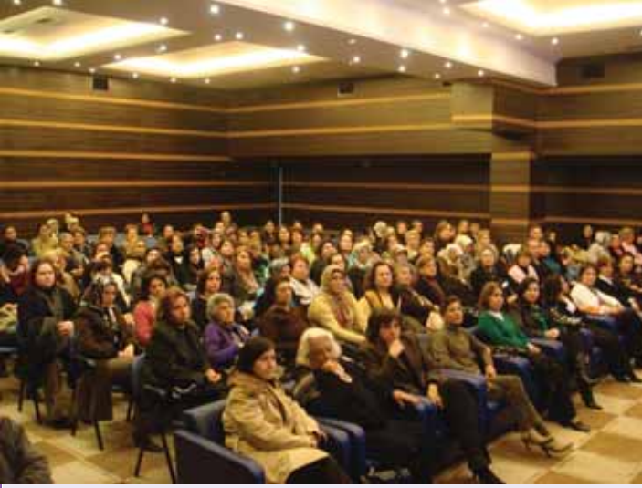
Alanya Kadın Meclisi Genel Kurulu

Geçtiğimiz yıl KİHEP'e katıldık, ardından bir arada olabilmemizin yollarını aradık. Kent Konseyi bünyesinde kurulacak "Kadın Meclisi"nde yer almak istedik. İşte hikâye bundan sonra başladı.